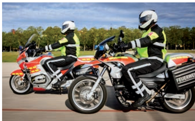
Die Motorräder werden als Kradstaffel eingesetzt

Vom Verein wurde die mitgeführte Ausrüstung angeschafft. Außerdem ermöglichte er die Beklebung der Maschinen mit roten und gelben Signalfolien, um die Wahrnehmung als Feuerwehrdienstfahrzeuge zu verbessern. ■