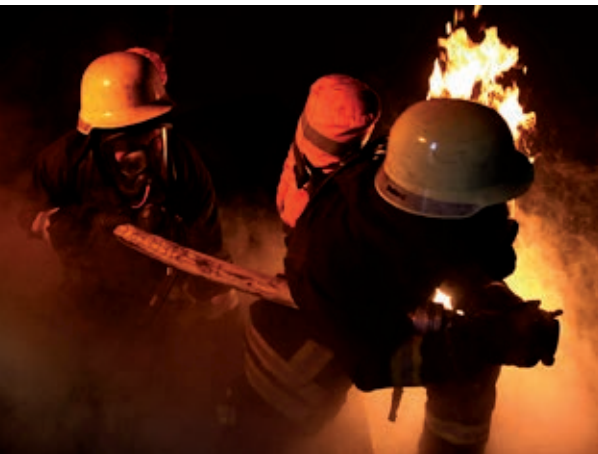
Neben der Brandbekämpfung gibt es mittlerweile viele weitere Aufgaben

Zur Erledigung dieser vielfältigen Aufgaben ist eine umfangreiche Ausbildung erforderlich. ■