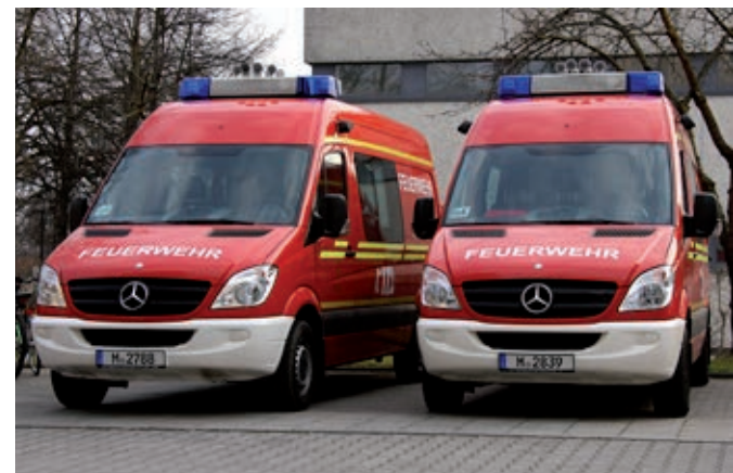
Die beiden baugleichen Gerätewagen IuK

Für diese Aufgabenbereiche werden Ausrüstungsgegenstände wie zum Beispiel AWITELs (digitale Feldtelefone), Schnelleinsatzzelte, IT- und Netzwerk-Ausrüstung sowie eine umfangreiche Funkausrüstung vor Ort mitgeführt. ■