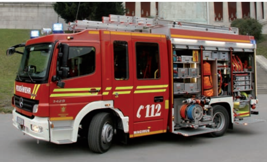
Eines der beiden HLF 20/16

Funkrufnamen: Florian München Sendling 40.1 und 40.2, Besatzung: jeweils 1/7/8 (1 Führungsperson und 7 Personen als Mannschaft, Gesamtstärke: 8)